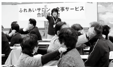
サロン・食事サービス合同研修会 サロンで活用できるレクリエーションを体験しています

それぞれの地域に合わせ、子育て支援、高齢者・障がい者支援、見守り活動などの地域福祉活動を行います。また、地域福祉活動団体（ふれあいいきいきサロン、ボランティア団体など）への活動支援・活動助成を行います。