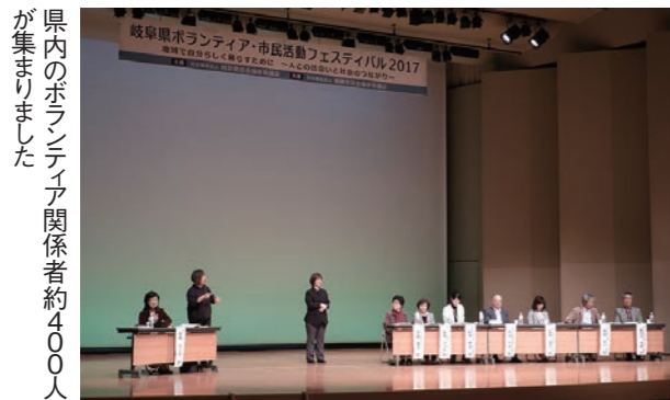
県内のボランティア関係者約400人が集まりました