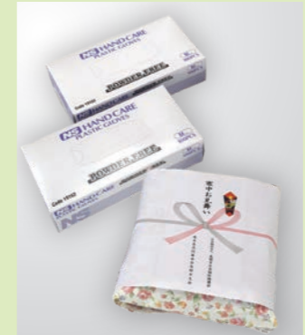
肩掛け、使い捨てゴム手袋をお届けしました