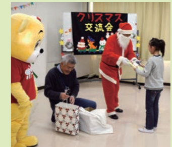
特別支援学級クリスマス交流会の様子(旧恵那地区)

市内小中学校の特別支援学級合同クリスマス会、小規模施設のクリスマス会などでプレゼントを贈りました。