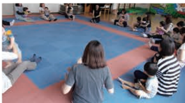
大井児童センター「赤ちゃん教室」