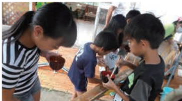
中野児童センター「夏休み教室」