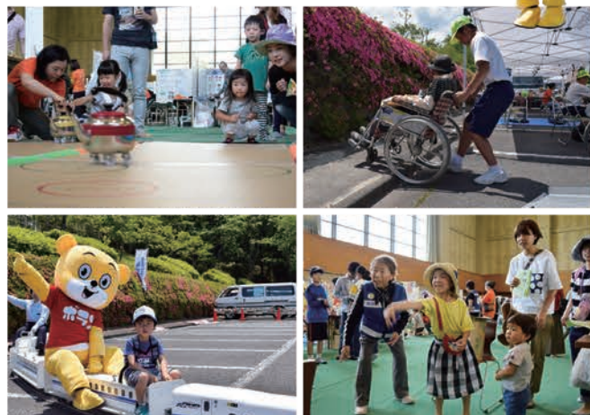
※「福祉フェスティバル」は、共同募金の配分金により実施しています。

天候に恵まれ、たくさんの方々で賑った今回の健幸フェスタinえな。全体で延べ8,000人(市発表)、福祉フェスティバル各コーナーには延べ4,000人を超える方々がご来場くださいました。ありがとうございました。