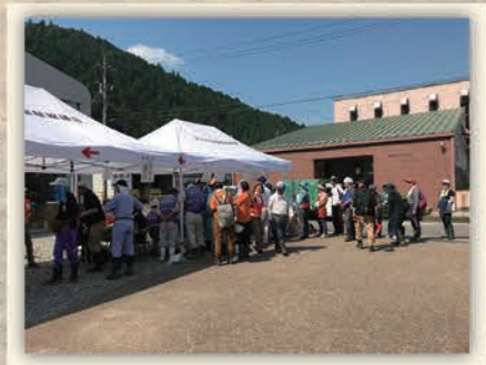
受付に並ぶたくさんのボランティア

ボランティアなどの目的で被災地に行く際は、事前に現地社会福祉協議会等のウェブサイトにて、被災状況やボランティアセンターの最新情報をご確認ください。