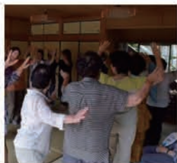
歌や踊りを楽しむサロン(笠置町・南いきいきサロン)

恵那市社協が支援する「ふれあいいきいきサロン」は、地域で集いの場を作り交流する、地域住民の自主的な活動です。気軽に集まって交流を深めることにより、いきいきとした生活を過ごすとともに、閉じこもりや寝たきりなどの予防や、孤独感の解消にもつながります。