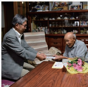
市内の長寿者に敬老を祝う記念品を贈呈

昨年度は社協特別会費として、2,629,892円のご協力をいただき、地域福祉活動事業に活用させていただきました。今年度も社協特別会費へのご理解とご協力をよろしくお願いいたします。