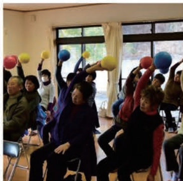
ふれあいいきいきサロン(大井:1区健幸クラブ)

みなさまからいただいた会費は、ふれあいいきいきサロン、食事サービスの支援、長寿者祝い、福祉活動団体への支援などの地域福祉事業の貴重な財源となっています。