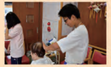
デイサービスセンターでの活動