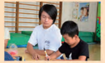
児童センターでは工作をお手伝い