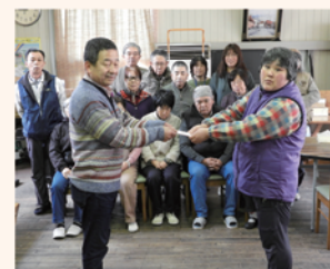
上矢作支部 見舞金や靴下をお届けし、周辺の清掃を行いました