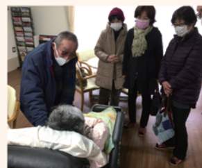
山岡支部 市内の5施設にみかんをお届けしました