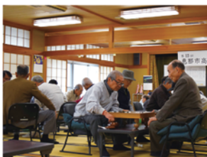
会場は真剣勝負の張りつめた空気に包まれました