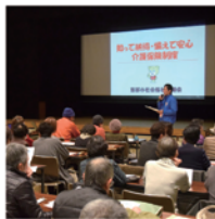
平成29年度合同研修会の様子

日時 2月18日 月 13:30~15:15 (受付13:30~) 会場 岩村福祉センター2階