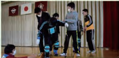
高齢者疑似体験(長島小学校)

ボランティア・市民活動支援センターでは、小・中学校に出向いて行う体験型講座「出前講座」を実施しています。福祉学習応援隊(地域のボランティアさん)や社協職員が講師となり、高齢者疑似体験、手話・点字・車いすの体験、障がいを持っている方によるお話しなどを行う、福祉をより身近に感じることができる講座です。