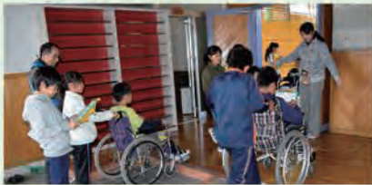
車いす体験(岩邑小学校)