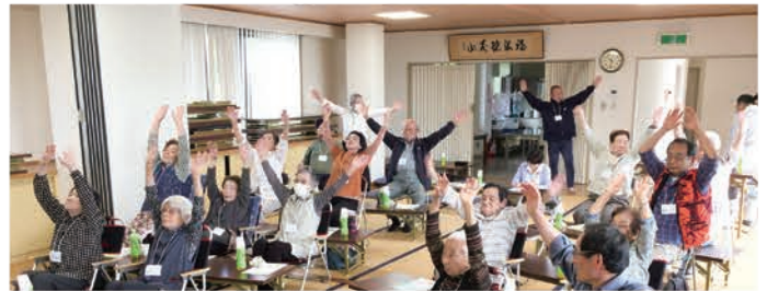
大井支部「おしゃべり会」(5/15)

「社協支部」とは、市社協と連携して地域の福祉活動を推進する、地域住民により組織される団体です。 恵那市内には13の社協支部があり、地域の特性をいかしながら地域内の福祉課題やニーズなどに対して、主体的・自発的に取り組んでいます。 社協支部では、地域のみならずの参加と協力により、ふれあい・いきいきサロンや子育てサロン、ひとり暮らし高齢者交流会など、それぞれの地域に合わせたきめ細やかな地域福祉活動が実施されています。