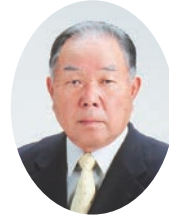
社会福祉法人 恵那市社会福祉協議会