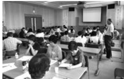
第2回ボランティア交流会

ボランティアの啓発・PR・普及のため、団体相互の親睦と交流を深めることを目的として開催。市内21団体、40名の参加者が講演と交流会に参加し、普段は交流がない方々が交流を深め、悩みや不安を共有しながら、活動の課題などについて意見交換を行いました。