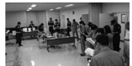
災害ボランティアセンター設置訓練の様子

恵那市防災訓練に合わせて実施。災害時の市と社協との連携強化を目的に、市職員と市社協役員23名が災害ボランティアセンター運営マニュアルの確認や模擬訓練を行い、連携と運営の手順を確認・検証しました。