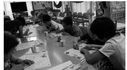
夏休み福祉施設ボランティア体験学習の様子

夏休み期間に市内小中高生を対象に福祉施設ボランティア体験を実施。37カ所の施設のご協力により、229名が参加しました。