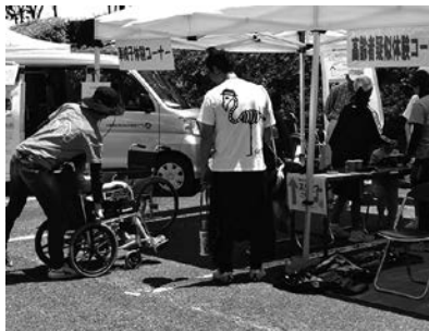
福祉フェスティバル体験コーナー

健幸フェスタinえなの福祉部門として開催されている福祉フェスティバルに参加。活動紹介や、さまざまなアクションを実施しました。ボランティア体験コーナーでは、朗読ボランティア体験や点訳ボランティア体験、福祉体験コーナーでは高齢者疑似体験や福祉車両体験などを行いました。