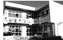
中野児童センター 長島町中野483-8 TEL0573-26-3878