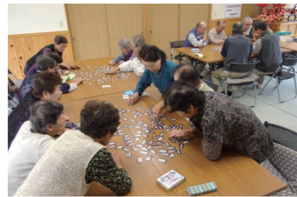
▲「漢字パズル」で楽しく頭の体操(武並町:まめやっぴかなもサロン)

☆地域ふれあい「いきいきサロン」に準じた活動をしている団体は、登録サロンと位置づけさせていただいております。登録していただくことにより、「ふれあいサロン・社協行事傷害補償(保険)」に加入することができます。