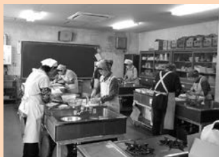
毎月行っているお弁当作り

60代から80代の方が中心となって18名の会員で活動している「明智町食生活改善推進協議会」。ひとり暮らし高齢者の集いへのお弁当作りなどの活動を行っています。お弁当作りでは、お彼岸はおはぎ、夏はちらし寿司、秋にはきのこご飯など、季節のメニューを多く取り入れるなどの工夫をしています。みなさんからの『美味しかったよ』の言葉が何よりの活動の励みになっています。