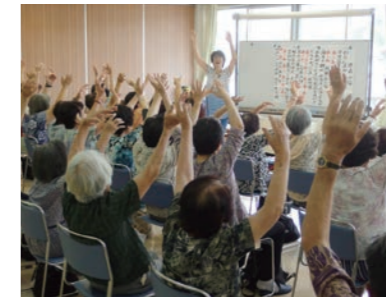
▲7月開催「音楽を使って楽しもう」講座の様子

恵那市社会福祉協議会では、高齢者が生きがいを持ち、明るく健康的な生活を続けていただくための講座を開催しています。毎月1回、健康講座や軽スポーツ、体操、遠足などを行います。講座を通して仲間づくりや健康づくりをしてみませんか？みなさまのご参加をお待ちしています。