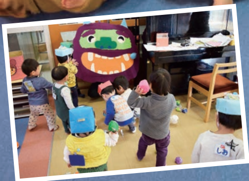
大井児童センターの「親子教室」で節分の豆まきを行いました。みんなで協力して鬼退治ができました。(詳細はP8参照)