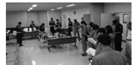
災害ボランティアセンター設置訓練の様子

恵那市防災訓練に合わせて実施。災害時の市と社協との連携強化を目的に、市職員と市社協役員23名が災害ボランティアセンター運営マニュアルの確認や模擬訓練を行い、連携と運営の手順を確認・検証しました。