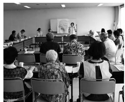
歯科衛生士さんによる口腔ケア講座

恵那市社協では、高齢になっても在宅でながく過ごしていただくために、介護や口腔ケアなどに関する知識を詳しくご紹介する講座「介護者教室」を市内各地域で開催しました。