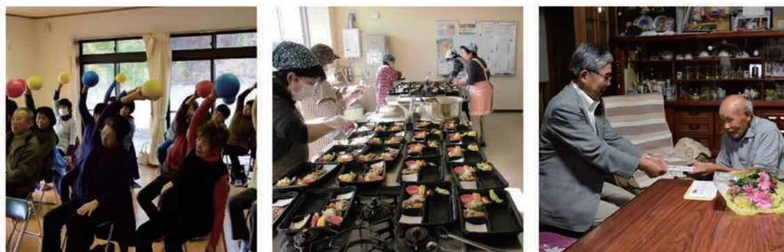
ふれあいいきいきサロン(大井:1区健幸クラブ) 配食サービス調理の様子(山岡:やまぶき会) 市内の長寿者に敬老を祝う記念品を贈呈

みなさまからいただいた会費は、ふれあいいきいきサロン、食事サービスの支援、長寿者祝い、福祉活動団体への支援などの地域福祉事業の貴重な財源となっています。