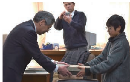
被災地へ温かい気持ちをお届けしました。