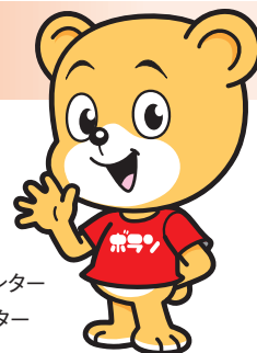
ボランティア・市民活動支援センター マスコットキャラクター ボランちゃん