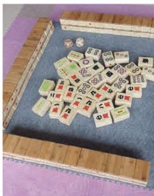
コミュニケーション麻雀セット(3セット)平成29年度整備