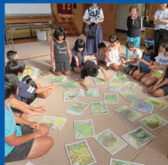
三代交流会おたのしみ会(サロン) 釜屋おしゃべり花の木会(山岡)

昨年度は社協特別会費として、2,580,000円のご協力をいただきました。今年度も社協特別会費へのご理解とご協力をよろしくお願いいたします。