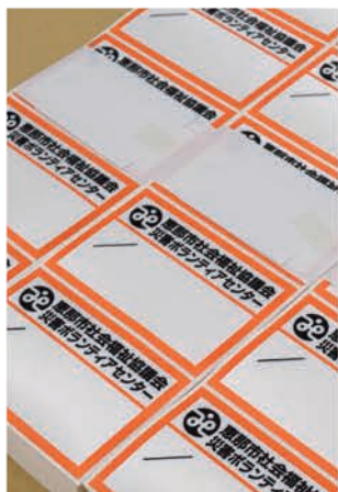
災害ボランティア用名札シール