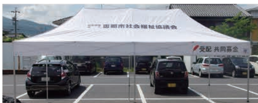
大型テント(折りたたみ式:1張)平成28年度整備