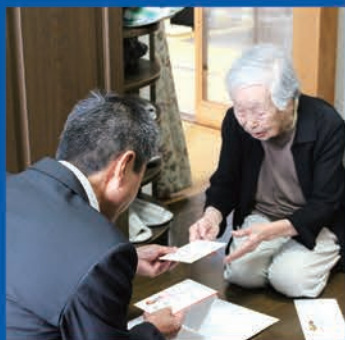
市内の長寿者にお祝いとして記念品を贈呈

特別会費は、ふれあいいきいきサロン、ふれあい食事サービス、長寿者のお祝い、市内の障がい児者や子ども、高齢者などを対象として活動する福祉活動団体への支援など、 地域福祉事業の貴重な財源となっています。