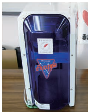
電動アイスライザー(かき水機:1台)平成27年度整備

社協貸し出し備品紹介 この他にも無料貸し出しを行っています。地域の行事等にご活用ください。