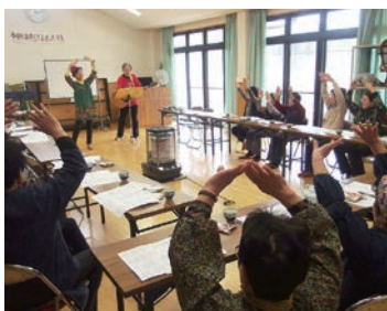
毎月楽しく活動するサロン(山岡町:久保原なまなも広場)

恵那市社会福祉協議会が支援する「ふれあいいきいきサロン」は、地域で集いの場をつくり交流する、地域住民の自主的な活動です。気軽に集まって交流を深めることにより、いきいきとした生活を過ごすとともに、閉じこもりや寝たきりなどの予防や、孤独感の解消にもつながります。