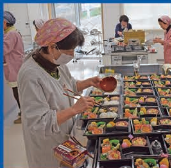
ボランティアが調理・配達する配食サービス(笠置配食チーム)