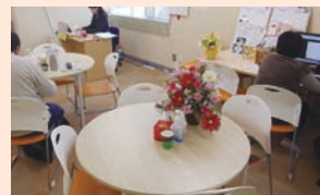
室内にはパソコンやドリンクコーナーなどもあります