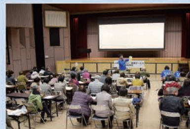
新規サロン立ち上げを検討中の方もご参加ください

2月14日(金) 13:00～15:15(受付13:00～) 東野コミュニティセンター 大会議室