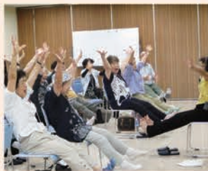
体操や歌など、気軽に参加できる講座を予定しています