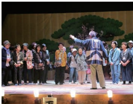
秋の遠足で「かしも明治座」を見学

高齢者が生きがいを持ち、明るく健康的な生活を続けていただくための講座を開催しています。毎月1回、健康講座や軽スポーツ、体操、遠足などを行います。講座を通して仲間づくりや健康づくりをしてみませんか？みなさまのご参加をお待ちしています。