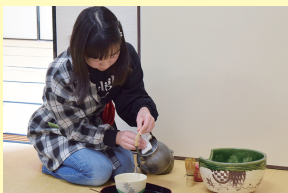
茶道クラブ活動の様子