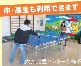
大井児童センターの様子

児童センターは18歳 までの子どもが利用で きる施設です。それぞ れの児童センターに は卓球台があり、開館 日には自由に利用で きます。ぜひ遊びに 来てください。