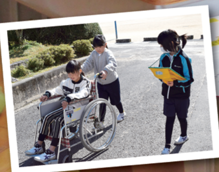
車いす体験 (明智小学校)

実際に体験してみることで福祉を学ぶ社協の出前講座「福祉体験学習」を行っています。(詳細はP3へ)