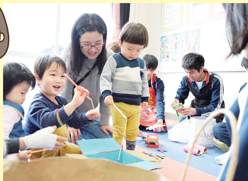
東中3年生との交流会の様子