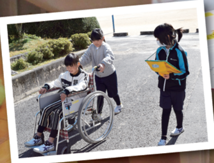
車いす体験 (明智小学校)

実際に体験してみることで福祉を学ぶ社協の出前講座「福祉体験学習」を行っています。(詳細はP3へ)