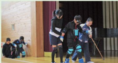
高齢者疑似体験(武並小学校)