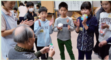
岩村デイサービスとの交流(岩邑小学校)

ボランティア・市民活動支援センターでは、小・中学校に出向いて行う体験型講座「出前講座」を実施しています。福祉学習応援隊(地域のボランティアさん)や社協職員が講師となり、高齢者疑似体験、手話・点字・車いすの体験、障がいを持っている方によるお話しなどを行う、福祉をより身近に感じることができる講座です。