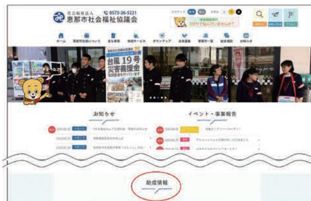
▲恵那市社協ホームページ

問い合わせ 恵那市ボランティア・市民活動支援センター(恵那市社会福祉協議会 地域福祉課) TEL0573-26-5221(代)