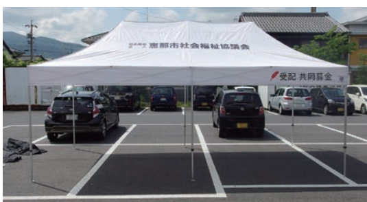
大型テント(折りたたみ式:1張)