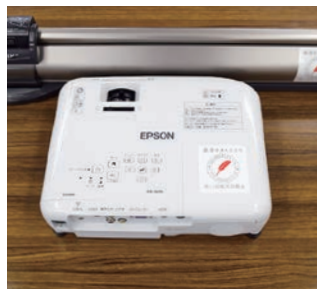
プロジェクター・スクリーン