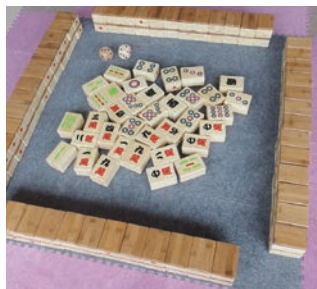
コミュニケーション麻雀セット