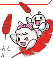
愛ちゃんと 希望くん