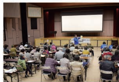
新規サロン立ち上げを検討中の方もご参加ください

問い合わせ 恵那市社会福祉協議会 地域福祉課 TEL0573-26-5221(代)