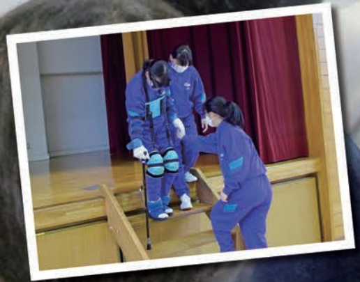
高齢者疑似体験(明智中学校)