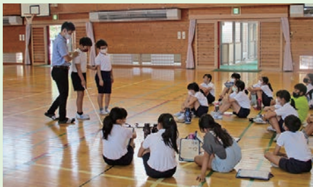
白杖体験(大井小学校)