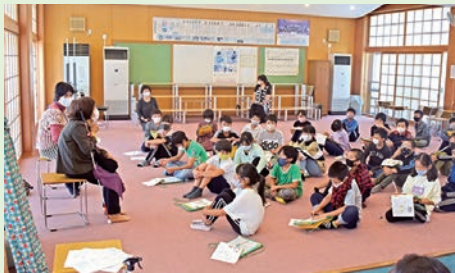
障がいについて考える学習(明智小学校)

ボランティア・市民活動支援センターでは、小・中学校に出向いて福祉を実際に体験して学ぶ「出前講座」を実施しています。福祉学習応援隊(地域のボランティアさん)や社協職員が講師となり、高齢者疑似体験、手話・点字・白杖・車いすの体験、障がいを持っている方によるお話しなど、福祉をより身近に感じることができる講座です。