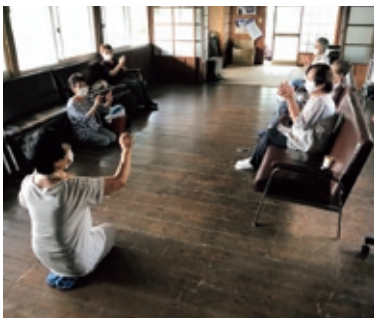
高齢者サロンの活動 (中野方町「坂折おしゃべり会」)

それぞれの地域に合わせ、子育て支援、高齢者・障がい者支援、見守り活動などの地域福祉活動を行います。また、地域福祉活動団体（ふれあいいきいきサロン、ボランティア団体など）への活動支援を行います。