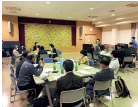
地域福祉懇談会の様子 (中野方地区)