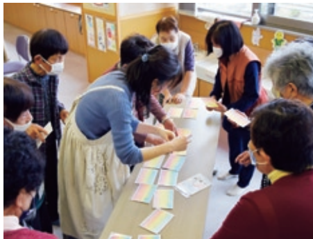
3色パステルアートで作品作り

高齢者が生きがいを持ち、明るく健康的な生活を続けていただくための講座を開催しています。毎月1回、健康講座や体操、作品づくりなどを行います。講座を通して仲間づくりや健康づくりをしてみませんか？みなさまのご参加をお待ちしています。