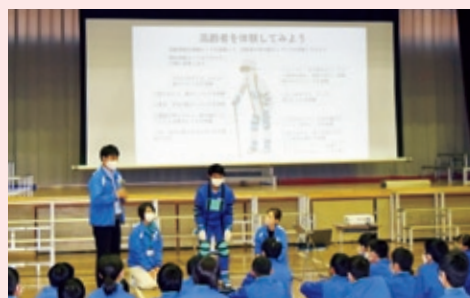
高齢者疑似体験 (恵那北中学校)