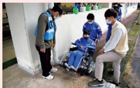
車いす体験 (岩呂中学校)

ボランティアセンターでは、小・中学校に出向いて福祉を実際に体験して学ぶ「出前講座」を実施しています。福祉学習応援隊(地域のボランティアさん)や社協職員が講師となり、高齢者疑似体験、手話・点字・白杖・車いすの体験、障がいを持っている方によるお話しなど、福祉をより身近に感じることができる講座です。