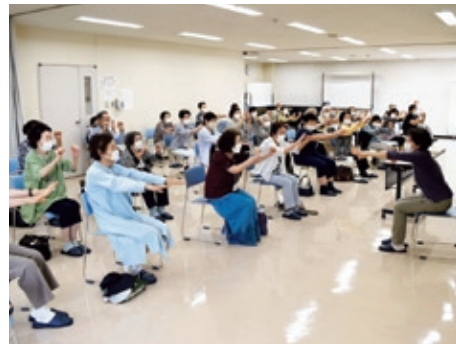
健康体操で元気な体づくり