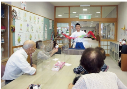
福祉施設ボランティア体験の様子(岩村いきいき教室)

災害ボランティアに関する講座・研修会の実施、災害ボランティアセンター設置訓練など災害発生時に備えた各種訓練の実施