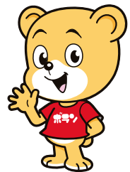
恵那市社協ボランティアセンター マスコットキャラクター ボランちゃん

市内のボランティア団体では、活動に参加する仲間を募集しています。老若男女問わず、活動の内容は様々ですので、お気軽にお問い合わせください。