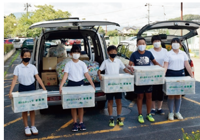
エコキャップ活動の様子(大井小学校)