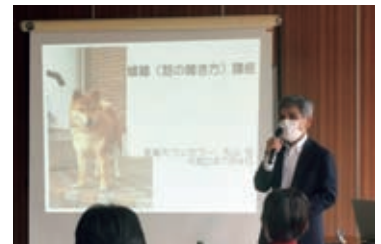
過去の講座の様子