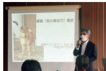
過去の講座の様子