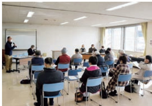
大井支部「サロン代表者交流会」

「社協支部」とは、市社協と連携して地域の福祉活動を推進する、地域住民により組織される団体です。恵那市内には13の社協支部があり、地域の特性をいかしながら地域内の福祉課題やニーズなどに対して、主体的・自発的に取り組んでいます。社協支部では、地域のみなさまの参加と協力により、高齢者・障がい者・子育て中の方を対象とした各種サロン、ひとり暮らし高齢者交流会など、それぞれの地域に合わせたきめ細やかな地域福祉活動が実施されています。