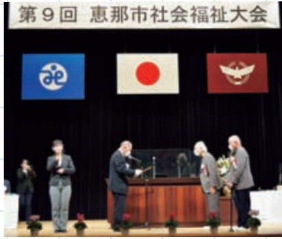
第9回 恵那市社会福祉大会