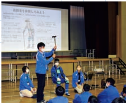
福祉学習の様子(高齢者疑似体験)

(10)ひとり暮らし高齢者情報紙 「まめなかな」の発行 月2回 ②長寿祝い金等の贈呈対象者150名 ③生きがい大学の開催 高齢者の生きがい活動等を支援 入校生65名 恵那校・恵南校各10回 ④福祉用具(車いす)の貸出 33件 ⑤広報・情報提供活動 月1回 ⑥広報紙の発行 ⑦ホームページによる情報提供 年間アクセス数 45,378件 ⑧行路人・罹災者等支援 罹災者援護事業 8件 行路人緊急援助 13件 ⑨ボランティアセンター事業 94件 ⑩窓口相談 ボランティア保険等加入実績 28,352名 ⑪ボランティア連絡協議会等への支援と助成 ⑫東濃5市社協災害ボランティアセンター設置運営訓練に参加 ⑬福祉教育・福祉体験学習 ⑭福祉学習(出前講座)の開催 合計20回 参加者延べ463名