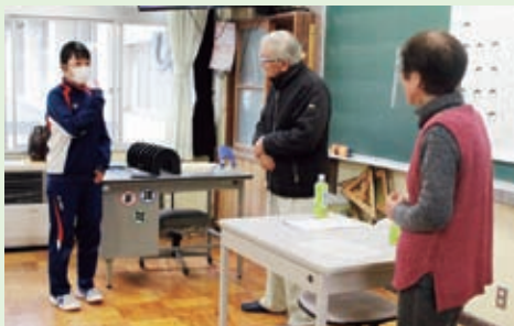
手話体験(串原中学校)

ボランティアセンターでは、小・中学校に出向いて福祉を実際に体験して学ぶ「出前講座」を実施しています。福祉学習応援隊(地域のボランティアさん)や社協職員が講師となり、高齢者疑似体験、手話・点字・白杖・車いすの体験、障がいを持っている方によるお話しなど、福祉をより身近に感じることができる講座です。