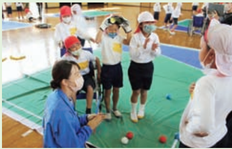
ボッチャ体験(中野方小学校)