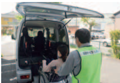
運転ボランティア活動の様子(移送サービスボランティア)