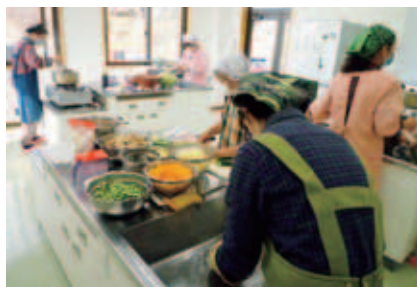
配食サービス活動の様子(串原配食サービス)

災害ボランティアに関する講座・研修会の実施、災害ボランティアセンター設置訓練など災害発生時に備えた各種訓練の実施