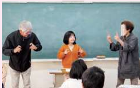
手話体験(明智小学校)