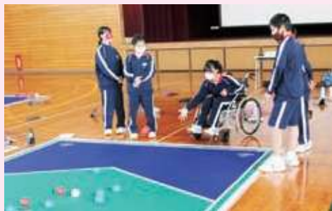
ポッチャ体験(恵那東中学校)

ボランティアセンターでは、小・中学校に出向いて福祉を実際に体験して学ぶ「出前講座」を実施しています。福祉学習応援隊(地域のボランティアさん)や社協職員が講師となり、高齢者疑似体験、手話・点字・白杖・車いすの体験、障がいを持っている方によるお話しなど、福祉をより身近に感じることができる講座です。