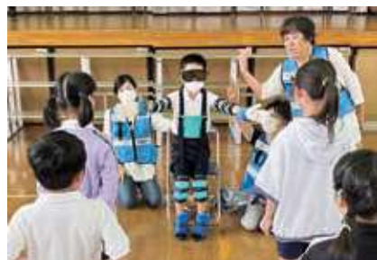
市内小中学校福祉学習の様子(福祉学習応援隊!)