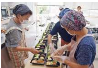
配食サービス活動の様子(笠置配食サービス)

災害ボランティアに関する講座・研修会の実施、災害ボランティアセンター設置訓練など災害発生時に備えた各種訓練の実施