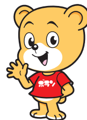
恵那市社協ボランティアセンター マスコットキャラクター ボランちゃん

市内のボランティア団体では、活動に参加する仲間を募集しています。老若男女問わず、活動の内容は様々ですので、お気軽にお問い合わせください。