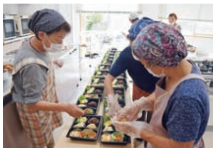
配食サービス活動の様子(笠置配食サービス)

災害ボランティアに関する講座・研修会の実施、災害ボランティアセンター設置訓練など災害発生時に備えた各種訓練の実施