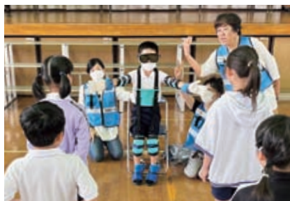
市内小中学校福祉学習の様子(福祉学習応援隊！)