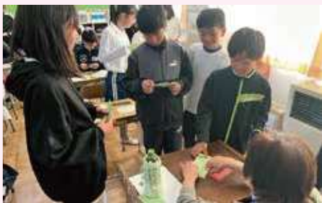
点字体験(長島小学校)

ボランティアセンターでは、小・中学校に出向いて福祉を実際に体験して学ぶ「出前講座」を実施しています。福祉学習応援隊(地域のボランティアさん)や社協職員が講師となり、高齢者疑似体験、手話・点字・白杖・車いすの体験、障がいを持っている方によるお話しなど、福祉をより身近に感じることができる講座です。