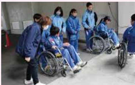
車いす体験(岩邑小学校)