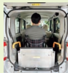
車椅子で乗車した車内の様子