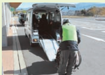
福祉有償運送サービスの様子