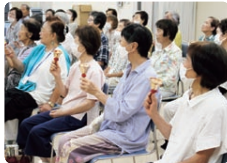
息を合わせて合奏しました