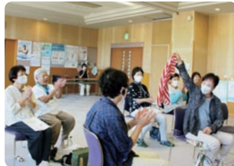
参加型のマジックショーを楽しみました