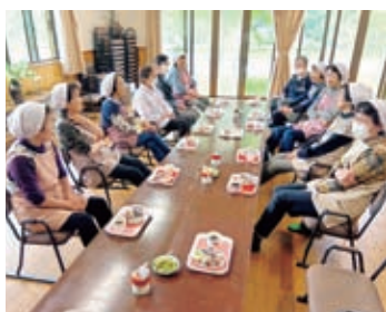
高齢者サロンの活動 (明智町) サロンみろく

それぞれの地域の実状に合わせて、子育て支援、高齢者・障がい者支援、見守り活動などの地域福祉活動を行います。また、地域福祉活動団体（ふれあいいきいきサロン、ボランティア団体など）への活動支援を行います。