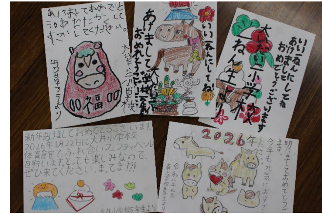
令和7年度、小学生から地域のお年寄りや関係者の方々に年賀状を送り、喜んでもらいました。